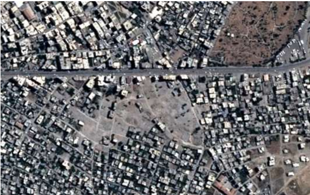
Satellite imagery recorded before and after building demolition in the neighborhoods of Cudi and Sur.