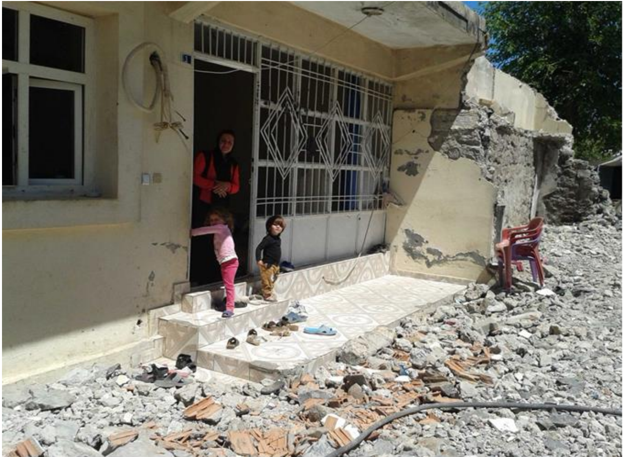
Fotoėraf: Çatıřmalarda hasar gören evini yeniden kullanılabilir hale getirmeye çalıřan bir kadın.

Yapılan arařtırmada yasak öncesinde yařanan çatıřmalı süreç ile yasak ve sonrasındaki dönemin kadın ve çocuklar üzerinde ağır travmalar yarattığı gözlemlenmiş ve kadınların aktarımı ile tespit edilmiştir. Sonbahardan yasak gününe dek her gün silah seslerinin eksik olmaması ve yer yer ağır çatıřmaların yařanması kadınlarda ciddi korkuya neden olmuřtur. Yasak öncesi bu durumun bu kadar ağır yařanıyor olması kadınların kendileri ve çocuklarının hayatından endiře duymasına ve göç etmesine neden olmuřtur. Kadınlar; özellikle Cizre’de ve Silopi’de yasak sürecinde yařanan sivil cenazelerinin günlerce sokak ortalarında kalması ve basına yansıyan kadın iç çamařırlarının ve bedenlerinin teřhir edilmesine tanıklık etmişlerdir. Bu durum aynı uygulamalara maruz kalma endiřesini beraberinde getirdiğinden ağır psikolojik travmalar yaratmıştır. Nitekim kendi aktarımlarında “evden çıkarken kolluk güçleri iç çamařırlarımızı görmesinler diye sadece iç çamařırlarımızı alıp çıktık” demeleri yařanan travmanın boyutunu ortaya koymaktadır. Yine kadınların aktarımı ve gözlemimiz çatıřmalı ortama baėlı olarak çocuklarda silah seslerinden korkma, zırhlı araç görünce eve kaçma, alt ıslatma, uyku problemi, yalnız uyuyamama, tuvalete yalnız gidememe, bir oda da yalnız kalamama, dil tutulması, uykudan çıėlık atarak uyanma vb. psikolojik sıkıntıların oluřtuėu görülmektedir.