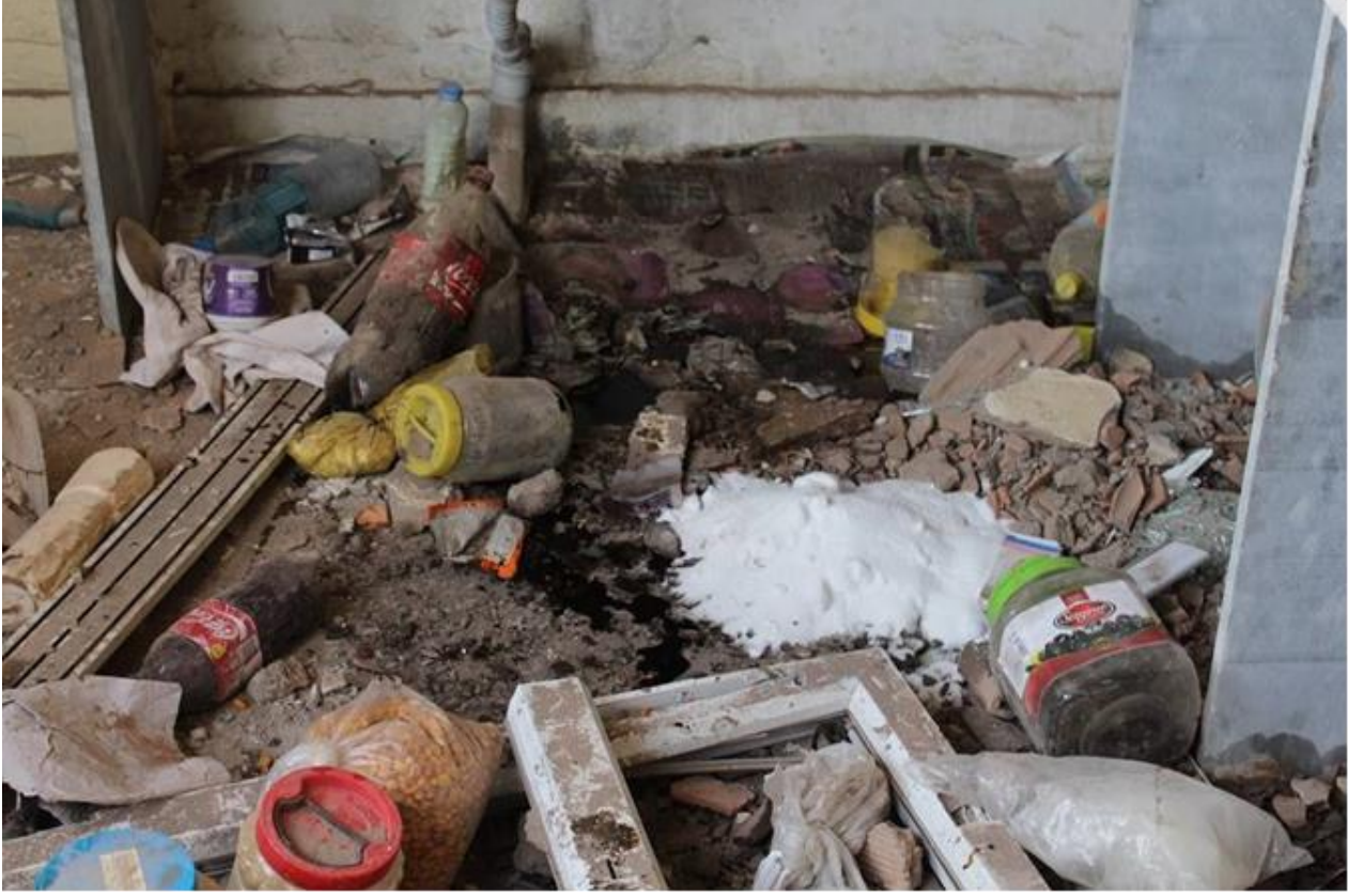
Fotoğraf: Çatışmalarda zarar gören bir evin mutfağı ve kullanılamaz hale gelen erzaklar.

N.T: “Barış istiyoruz, huzur olsun istiyoruz. Çocuklarım etkilendi. 1 yaşındaki çocuğum sürekli eve bomba atacaklar diyor, sürekli ağlıyor hiç uyumuyor. 6 yaşındaki çocuğum da silah seslerini duyunca altını ıslatıyor. Bunları görünce yasakta İdil’den ayrılıp köye yerleştik.”