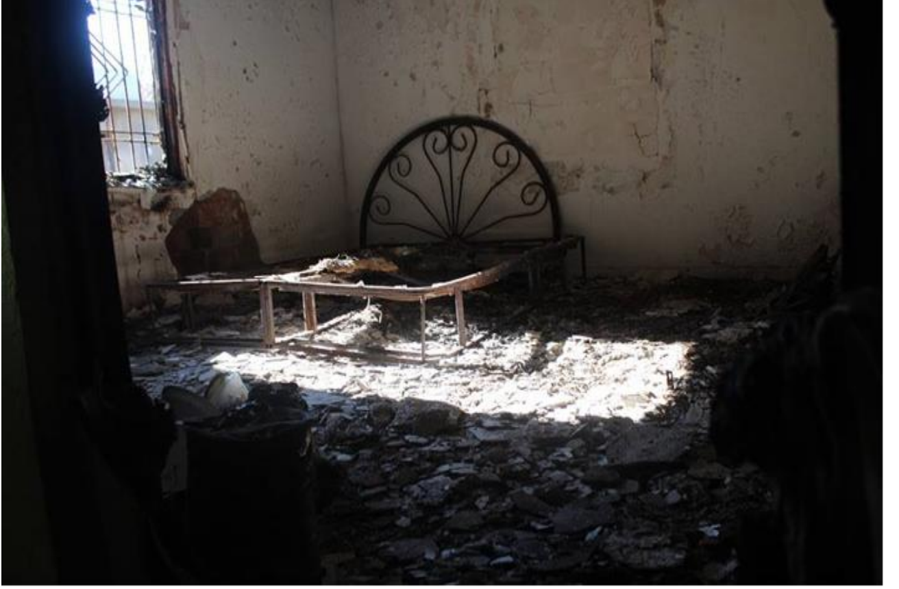
Fotoğraf: Bombalanma ve yakılma sonucu ağır hasar gören bir evin yatak odası.

S.İ: “Çocuklarımın psikolojisi bozuldu. Korkuyorlar altlarını ıslatıyorlar, çığlık atıyorlar, beni aranızda yatırın diğer odaya gitmeyelim diyorlar ve hala da devam ediyorlar.”