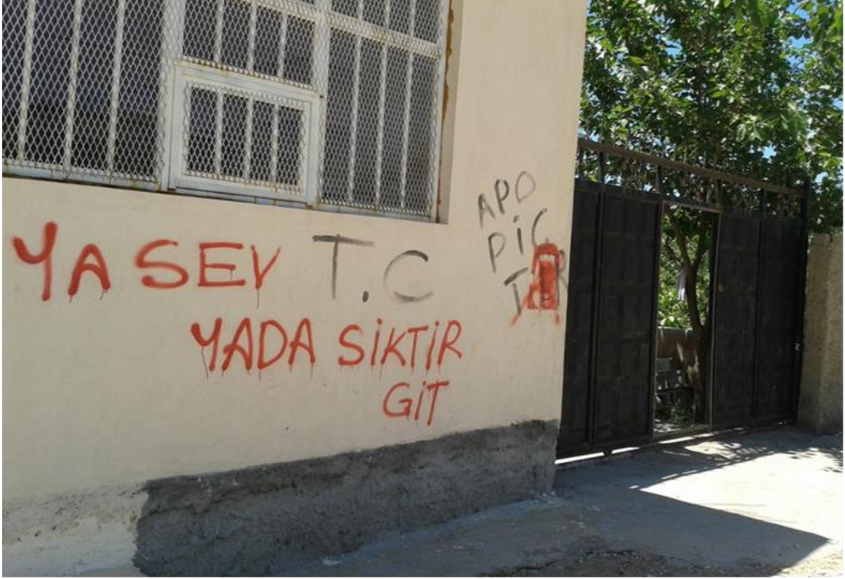
Fotoğraf: İdil'de güvenlik güçlerinin bir evin duvarına yaptığı ırkçı bir yazılama: T.C. Ya Sev Ya Terket!