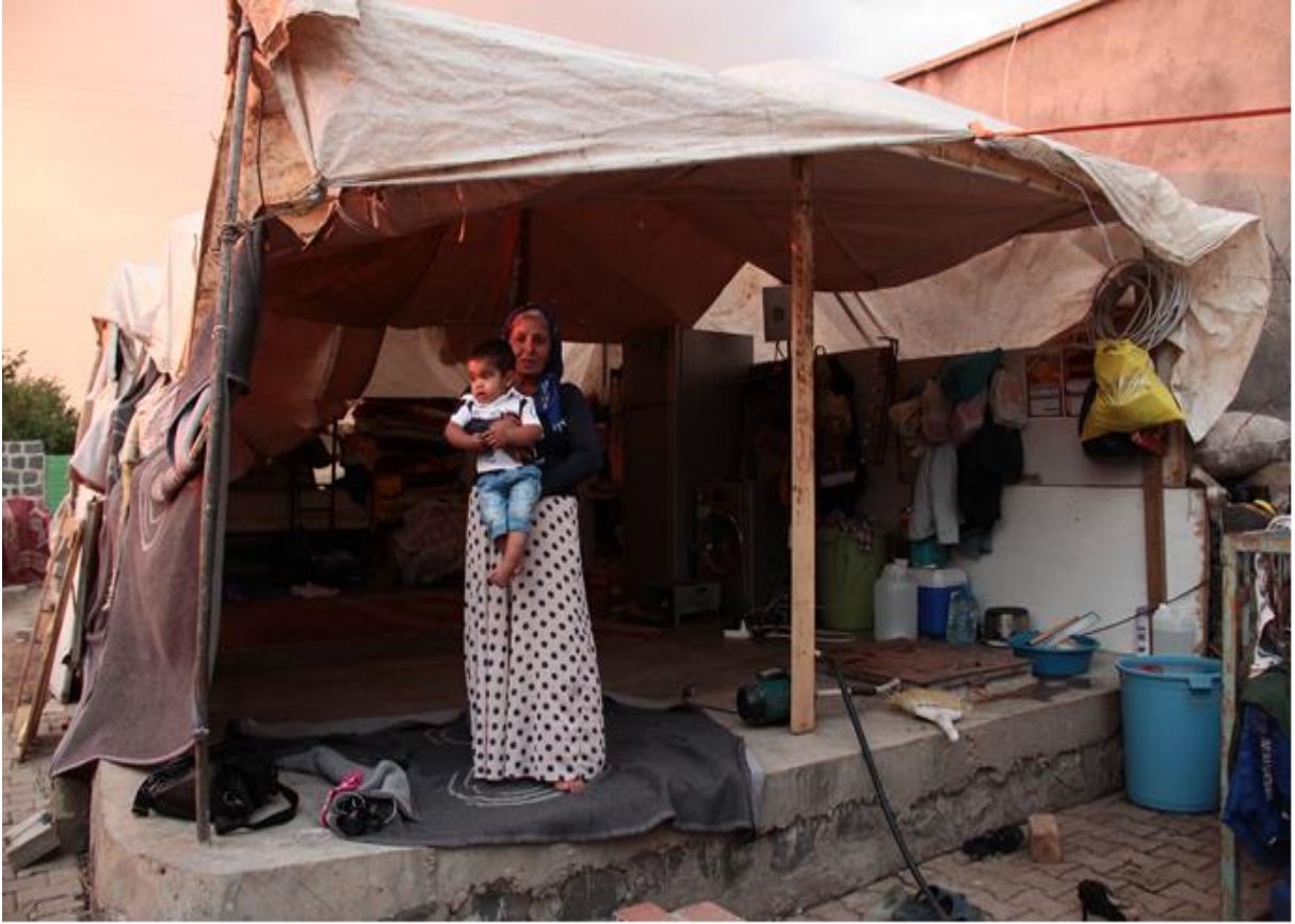
Fotoğraf: Evlerinin ağır hasar görmesi sonucu kendi imkanlarıyla evlerinin bahçesinde kurdukları barakada çocuklarıyla birlikte yaşayan bir kadın.

Çatışmaların yoğun yaşandığı Turgut Özal Mahallesi ve Yenimahalle’de GABB ve TMMOB (Türk Mühendis ve Mimar Odalar Birliği) tarafından gerçekleştirilen genel hasar tespit çalışmasında 2 ise, 1200 yapının hasar gördüğü (yaklaşık 1600 hane), bunlardan 700’ünün az hasarlı, 250’sinin orta hasarlı, 100’ünün ağır hasarlı ve 120’sinin yıkık yapı olduğu tespit edilmiştir. İdil belediyesi İtfaiye Müdürlüğü’ne yapılan başvurular neticesinde yaklaşık 150 hanenin yanmış olduğu belirlenmiştir. Çatışmalardan sonra İdil’in %80’e yakını ise yerel halkın isteği dışında ve hiçbir bilgi verilmeden Bakanlar Kurulu tarafından riskli alan ilan edilmiş, hasar gören veya görmeyen yapıların yıkımına başlanmıştır.