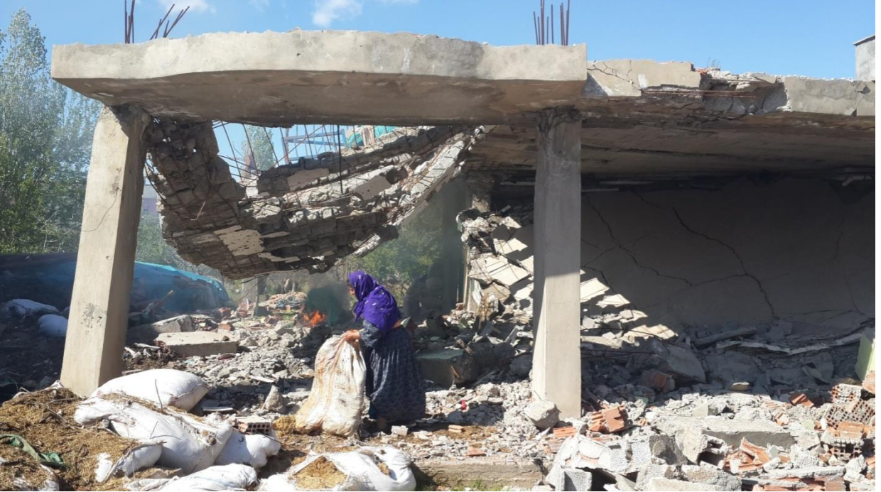
Fotoğraf: Çatışmalarda ağır bombardıman sonucu yıkılan bir ev ve evinden geriye kalanları toplamaya çalışan bir anne.