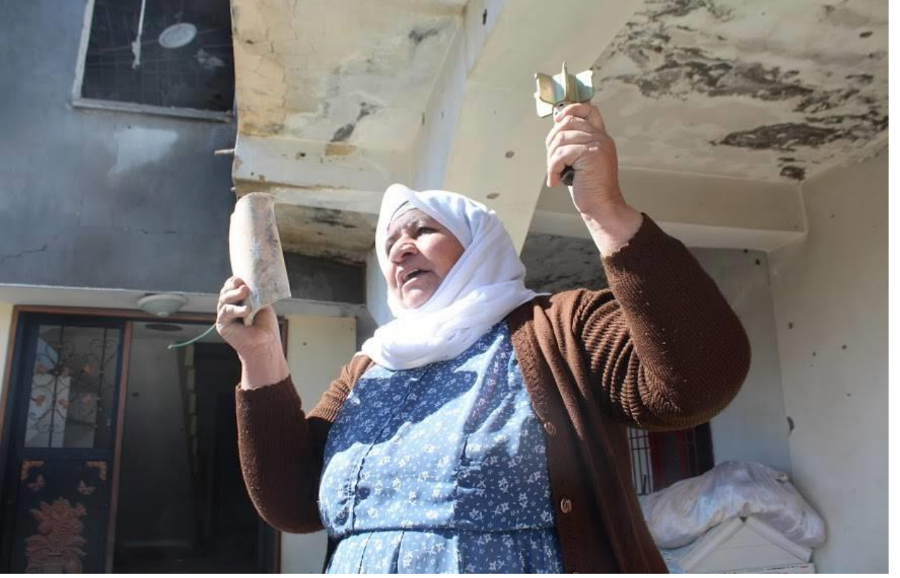
Fotoğraf: Bir elinde evinin içerisinde bulduğu askeri mühimmat ve diğer elinde yıkılan evinden çıkardığı kutsal kitaptan bir parça ile yaşananları anlatmaya çalışan bir anne.