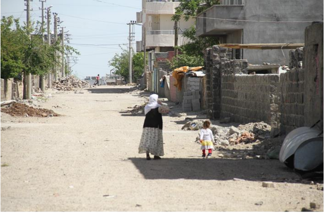
Fotoğraf: İdil’de sokağa çıkma yasağının sona ermesinden sonra bir sokağın görüntüsü.