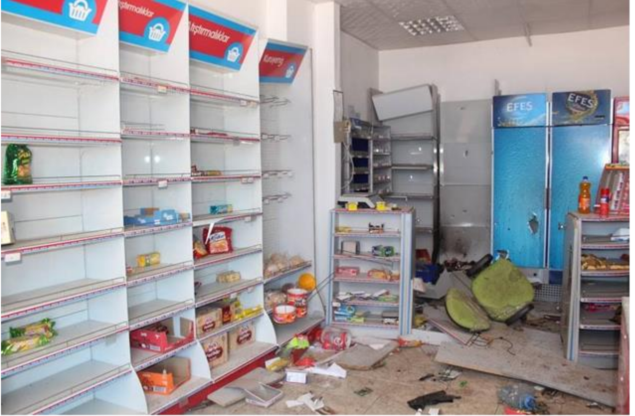
Fotoğraf: Sokağa çıkma yasağı süresinde çatışmalarda zarar gören bir market.

Görüşme yapılan hanelerde çatışma öncesi ve sonrası gelir durumlarında ciddi farklar olduğu gözlemlenmiştir. Evin geçimini sağlayan kişilerin çoğunluğunun erkek olduğu ve büyük bir kısmının işçilik (inşaat, temizlik, şoför vb.) veya informal sektörlerde çalıştığı tespit edilmiştir. Genel olarak bölgede sokağa çıkma yasakları ve Irak sınırının kapalı olmasından bu iki sektör de ağır bir şekilde etkilenmiş, bunun yanı sıra İdil'de de sokağa çıkma yasağı ilan edilmesi hanenin geçimini sağlayan bireyleri uzun bir süre çalışamaz kılmıştır.