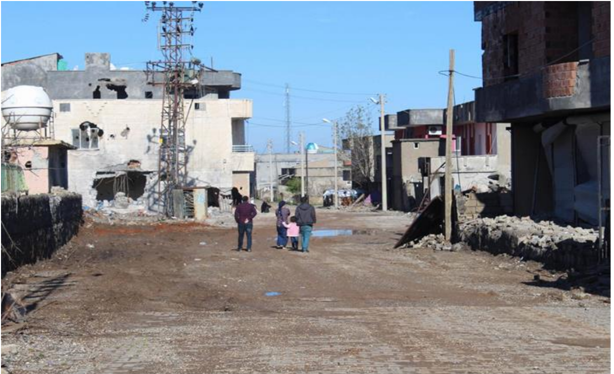
Fotoğraf: İdil’de sokağa çıkma yasağının sona ermesinden sonra bir sokağın yıkım görüntüsü.

Rapora ilişkin yapılan çalışmalar esnasından ve de basın tarafından çekilen görüntüler, rapor da açıklamalı olarak paylaşılmıştır.