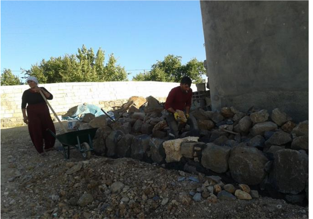
Fotoğraf: Yıkımdan sonra evini yeniden inşa etmeye çalışan bir aile.