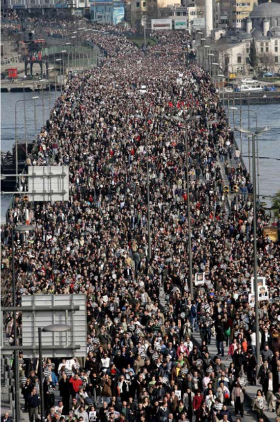
Hrant Dink için Agos Gazetesi'nde düzenlenen cenaze töreninin ardından Osmanbey'den Yenikapı'ya kadar düzenlenen sekiz kilometrelik sessiz yürüyüşe on binlerce kişi katıldı, 23 Ocak 2007.