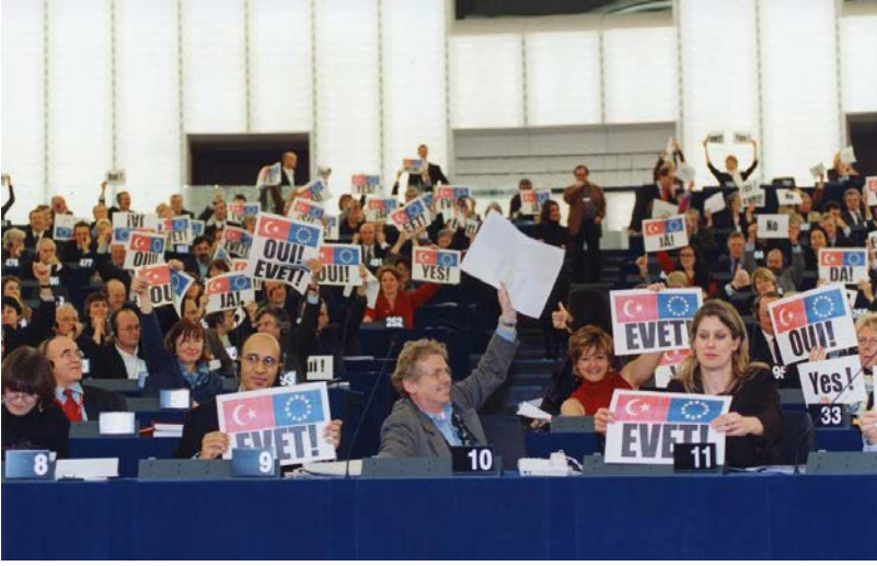
15 Aralık 2004, Avrupa Parlamentosu'nda Türkiye'nin AB ile üyelik müzakerelerinin başlamasına dair oylama (Kaynak: https://ab.gov.tr/37.html )