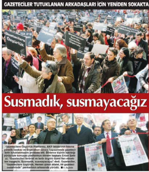
"Susmadık, susmayacağız", Cumhuriyet, 14 Mart 2011.

Tandoğan'da doğan ırmak İstanbul'da 'Çağlayan'a dönüştü. Milyonlar, laik demokratik Cumhuriyete sahip çıkarak halkın sesine kulak tıkayanlara bir kez daha mesaj verdi