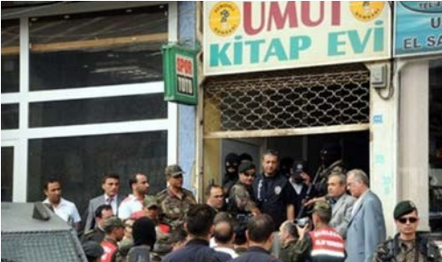
Hakkâri'nin Şemdinli ilçesinde bulunan Umut Kitabevi'ne bombalı saldırı düzenlendi, 9 Kasım 2005. Fotoğraf, bianet'in 20 Aralık 2021 tarihli haberinden alınmıştır: https://bianet.org/haber/umut-kitabevi-ni-bombalayan-iyi-cocuklar-beraat-etti-255081