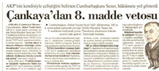
"Çankaya'dan 8. madde vetosu", Cumhuriyet, 01 Temmuz 2003. Cumhurbaşkanı Ahmet Necdet Sezer, VI. Uyum Paketi'nde yer alan değişikliklerden TMK'nin 8. maddesinin yürürlükten kaldırılmasını öngören düzenlemeyi bir kere daha görüşülmek üzere TBMM'ye iade etti.