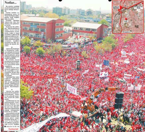
"En büyük uyarı", Cumhuriyet, 30 Nisan 2007.