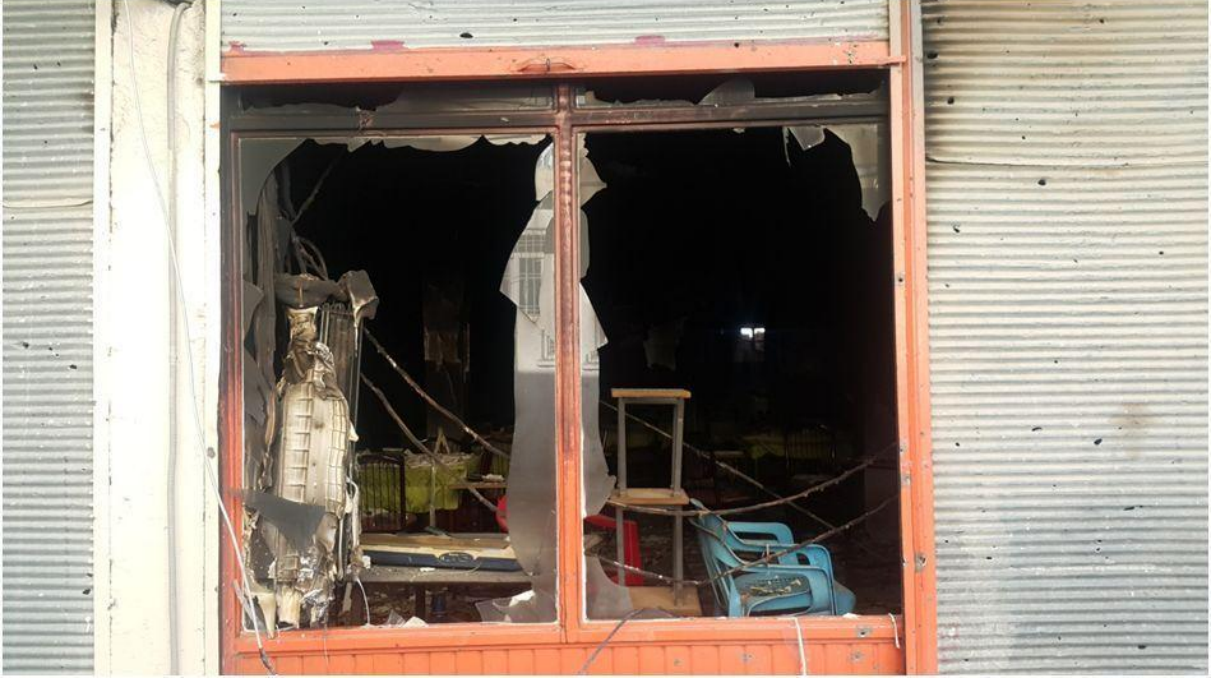
Sokağa çıkma yasağının olduğu mahallelerde bir çok dükkan ve iş yerinin zarar gördüğü gözlenmiştir.