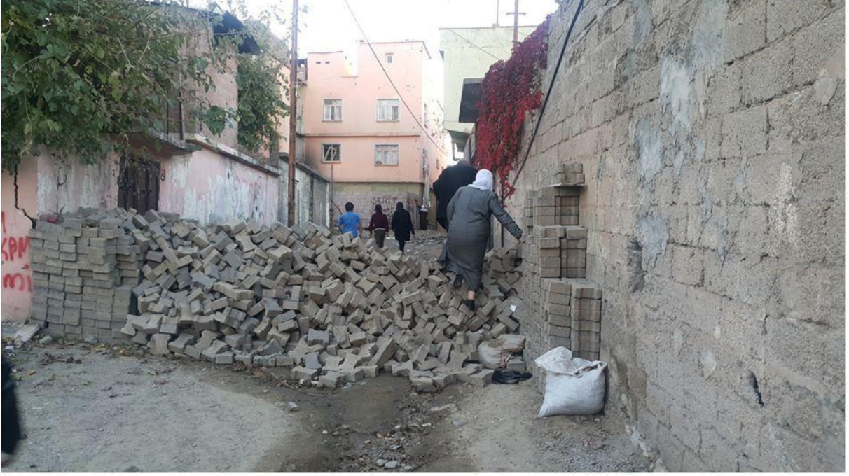
*Sokağa kurulan barikatlardan biri.

6-) Heyetimizin 8 Ekim 2015 tarihinde yaptığı incelemeler esnasında mahalle sakinlerinden alınan bilgilere göre; olayların yaşandığı günlerde sağlık hizmetlerinin durma noktasına geldiği, hiçbir sağlık merkezi ve özel tıp merkezinin hizmet veremediği ve kapalı olduğu, olayda ölen yurttaşın ve diğer yaralıların çatışmalar altında siviller tarafından özel araçlarla Silvan Devlet Hastanesi'ne götürüldüğü, Acil serviste yapılan müdahaleden sonra yaralıların Diyarbakır'daki hastanelere sevk edildiği anlaşılmıştır. Hem kolluk kuvvetlerinin güvenlik nedeniyle engellemeleri hem de sokaklardaki hendek ve barikatlar ambulansların olay yerine gitmelerini zorlaştırmış hatta kimi yerlerde de imkânsız hale getirmiştir.