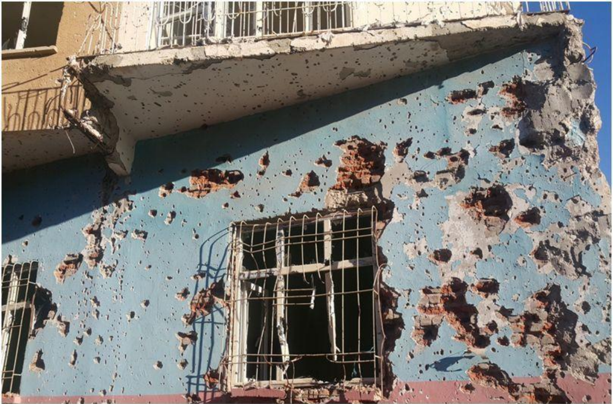
*Çıkan çatışmalarda kurşunlanan, camları kırılan evler

İçeriye taradılar, ben dışarı çıktım. 1 milyar civarında param içerde onu da götürmüşler. Oğlumun bilgisayarı vardı onu da götürmüşler. Kapıyı kırmışlar ( Evin diğer alanlarını gösteriyor. Ağır silahlarla duvarlar delinmiş. ) ve silahlarla eve ateş etmişler. Bize hiçbir şey bırakmamışlar. Buraları (tahrip olmuş eşyalarını gösteriyor) biz daha içerdeyken buraları böyle yaptılar. Ateş açtılar. Bilgisayarı çalınan çocuğum engelli, bir kolu ve bir eli yok onun bilgisayarını götürmüşler.