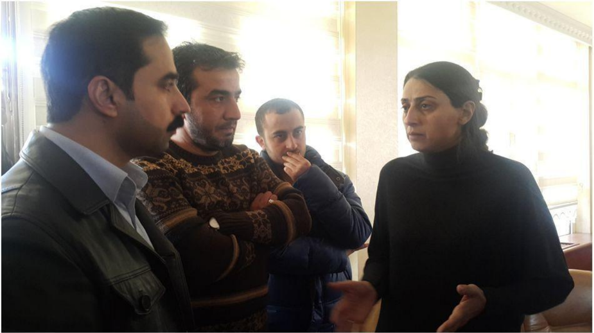
*Feleknas UCA ile Silvan Belediyesi'nde görüşmemiz.

150 kişilik bir heyet sokağa çıkma yasağının devam ettiği mahallelerde bulunmakta. Bu ekibin içinde HDP milletvekillerinden Nursel Aydoğan, Sibel Yiğitalp, Ayşe Başaran, DBP'den Ayla Akat ve HDP Diyarbakır İl Eş Başkanı Gülşen Özel de yer alıyor. Bu ekip 5 gündür içerde ve hâlâ haber alamamaktayız. (Görüşmemizin devam ettiği sıralarda)