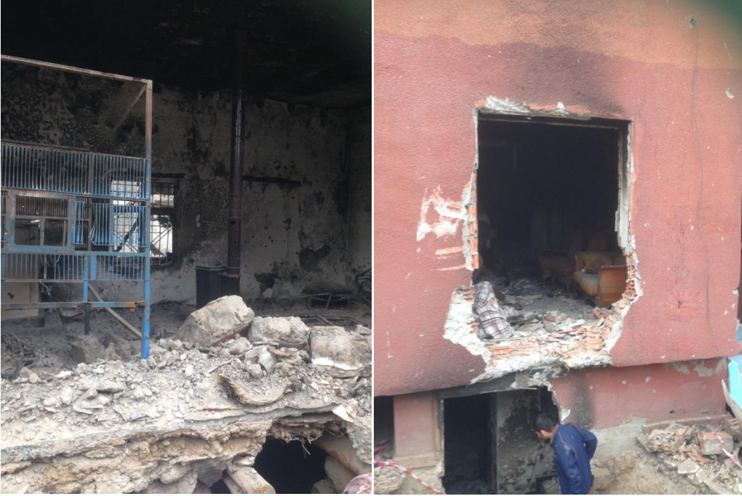
İlk bodrum girişi