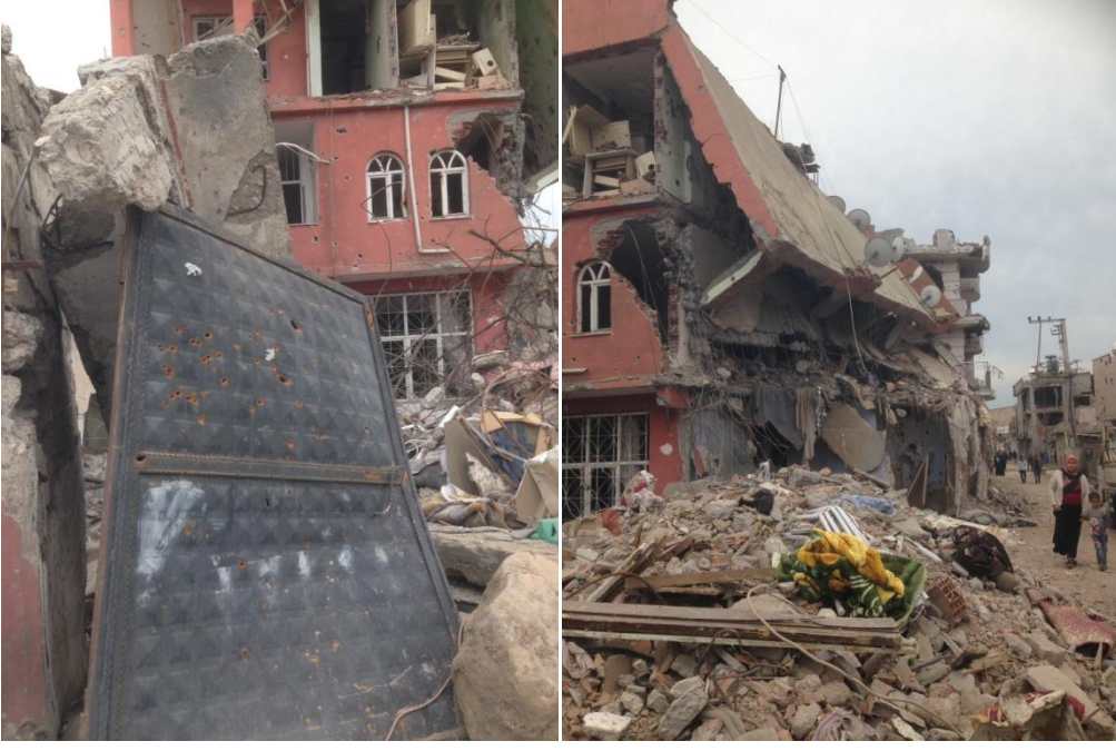
Yol üzerinde gözlenen tahribatları gösteren fotoğraflar